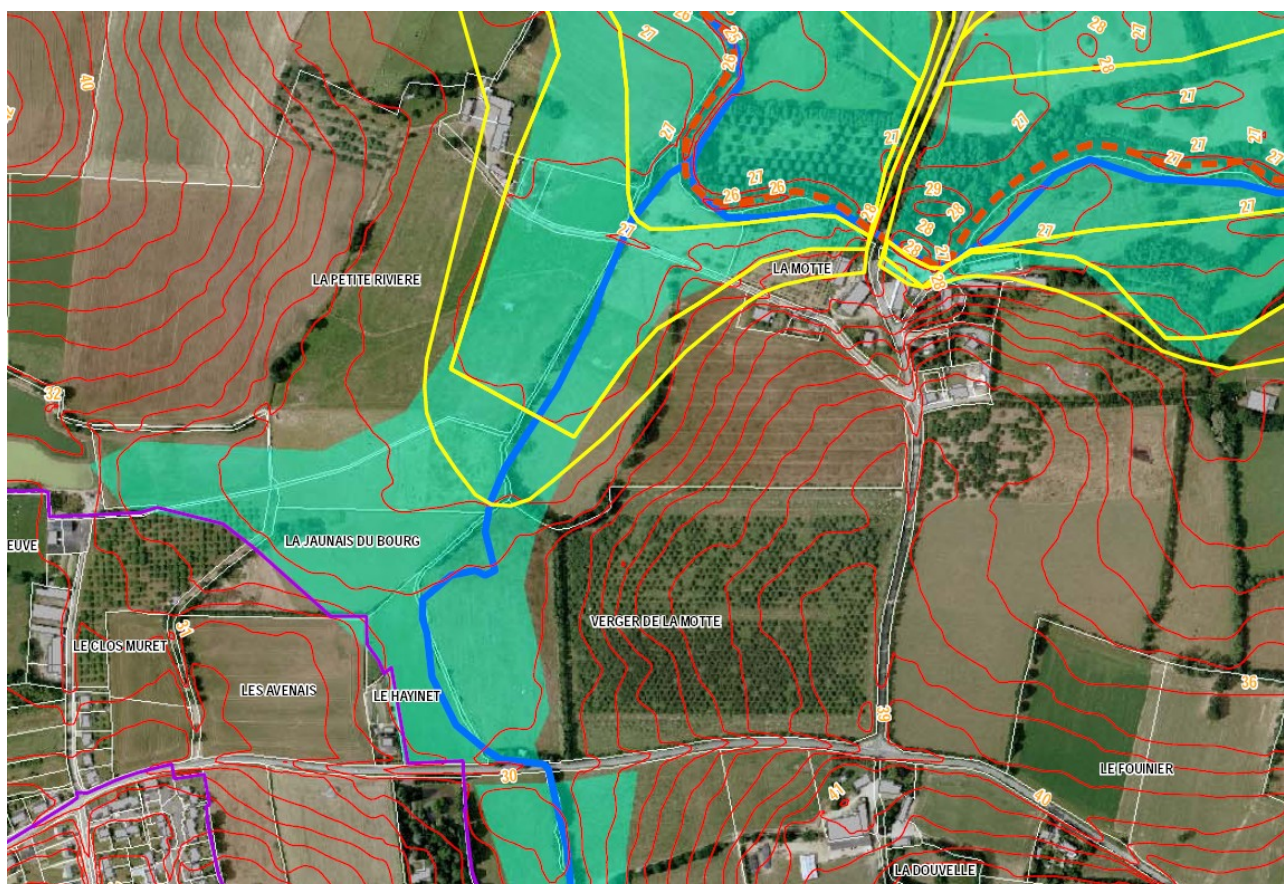
La Petite Rivière et La Motte, zones inondables de la commune de Saint-Armel recensées par le Plan de Prévention du Risque Inondation de la Seiche et de l'Isère (2008)

Les inondations qui affectent la commune de Saint-Armel sont dues au débordement de la Seiche et du Prunelais. Les crues de Seiche sont caractérisées par une montée parfois assez rapide des eaux (1 m en 12 heures en janvier 1995, soit une moyenne de 8 à 9 centimètres par heure). Il n'y a pas d'échelle de crue (mesure) sur la commune de Saint-Armel.