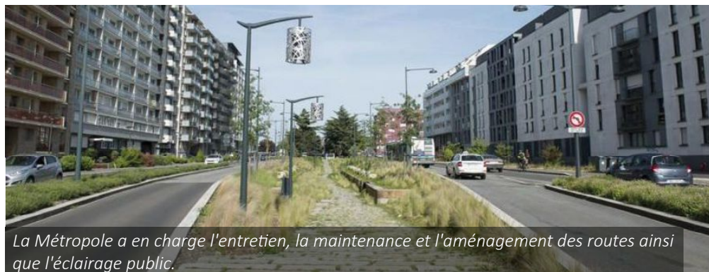
La Métropole a en charge l'entretien, la maintenance et l'aménagement des routes ainsi que l'éclairage public.