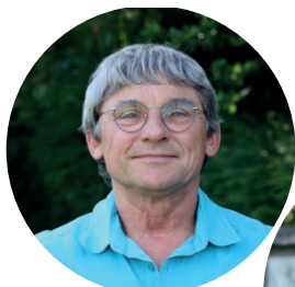
Les conseillers délégués