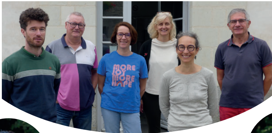
Mme la Maire et les adjoints