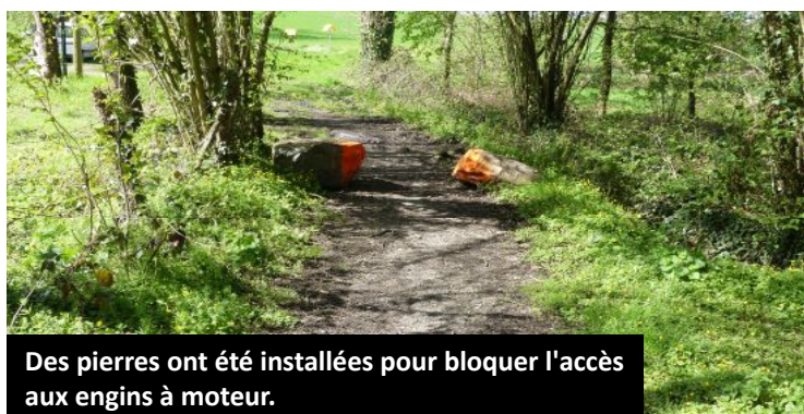
Des pierres ont été installées pour bloquer l'accès aux engins à moteur.

Nous rappelons que la circulation des véhicules à moteur, comme les quads, les 4x4, les motos, cause, sur les sentiers de randonnées, des dommages aux milieux naturels, à la faune et à la flore.