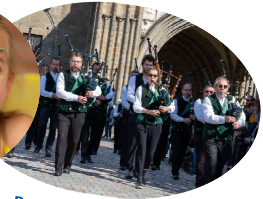
Bagad de Vern-sur-Seiche